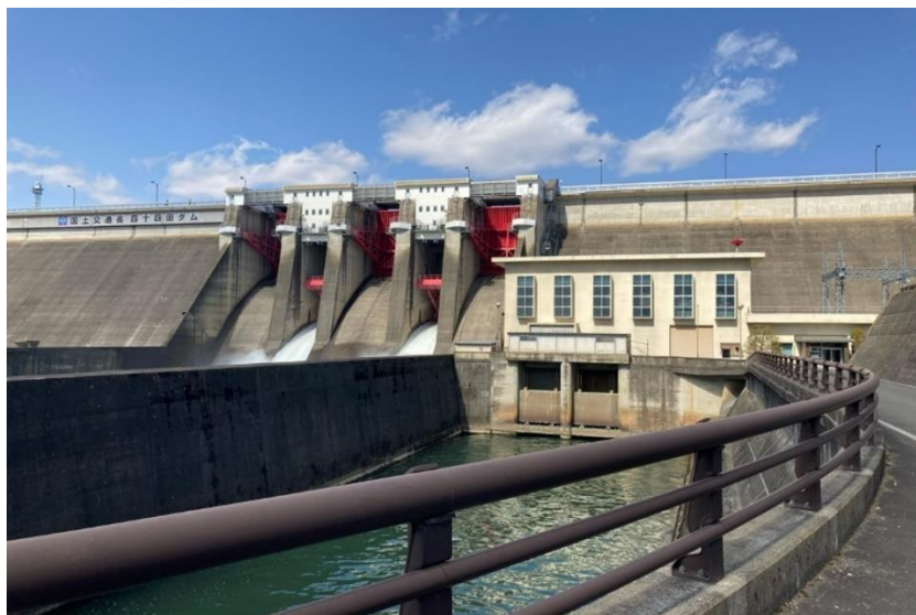
岩手県企業局の四十四田発電所(水力)

日立三菱水力株式会社(以下、日立三菱水力)と株式会社日立製作所(以下、日立)、株式会社日立産機システム(以下、日立産機システム)は、このたび、岩手県企業局の四十四田発電所(水力)の発電施設における保守・点検業務に対し、IoTやAI技術、現場メーターデータセンシングといったデジタル技術を活用したスマート化実証を行い、その第1フェーズを完了しました。